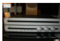
Pre-amplificatori Spectral DMC 20... € 4.500,00